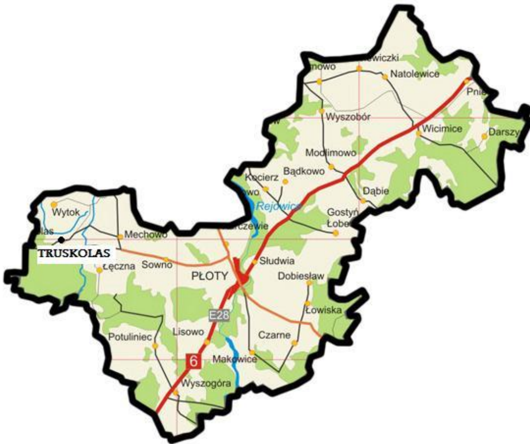
Mapa gminy Płoty