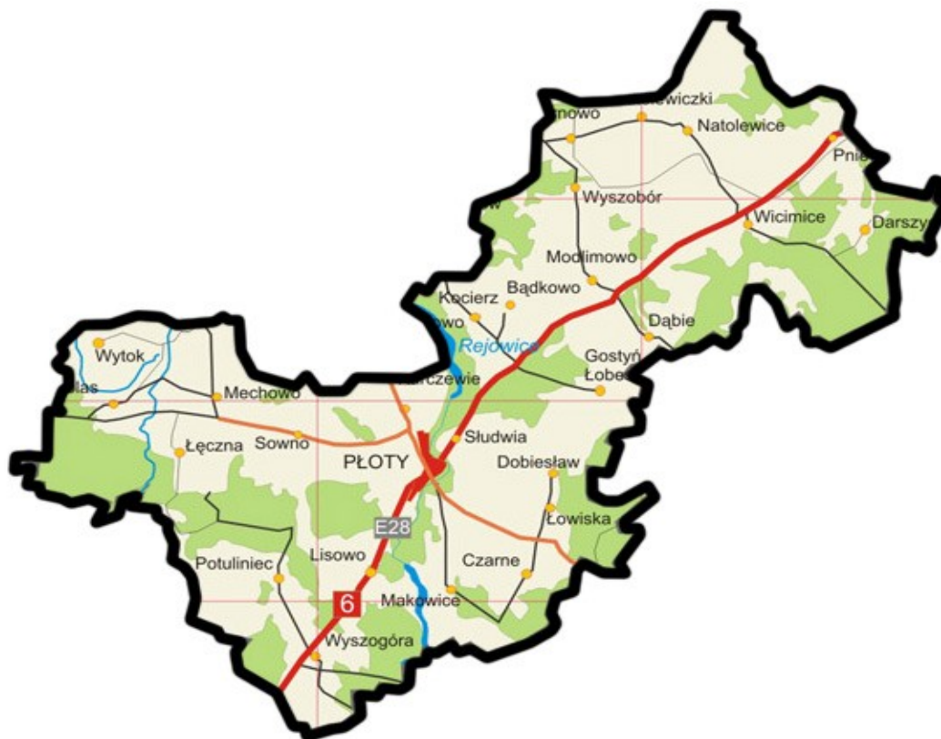
Mapa gminy Płoty

Miejscowość Lisowo leży w północnej części województwa zachodniopomorskiego, w powiecie gryfickim, w gminie Płoty, która sąsiaduje z gminami powiatu gryfickiego – Brojce, Gryfice, powiatu kołobrzeskiego – Rymań, powiatu łobeskiego – Resko, powiatu goleniowskiego – Nowogard i powiatu kamieńskiego – Golczewo.