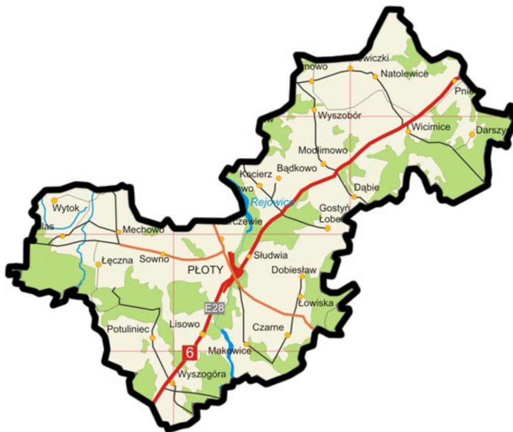
Mapa gminy Płoty

Wieś zajmuje powierzchnię 280,41 ha i zamieszkuje ją 111 osoby (stan na dzień 31.12.2009 r.).