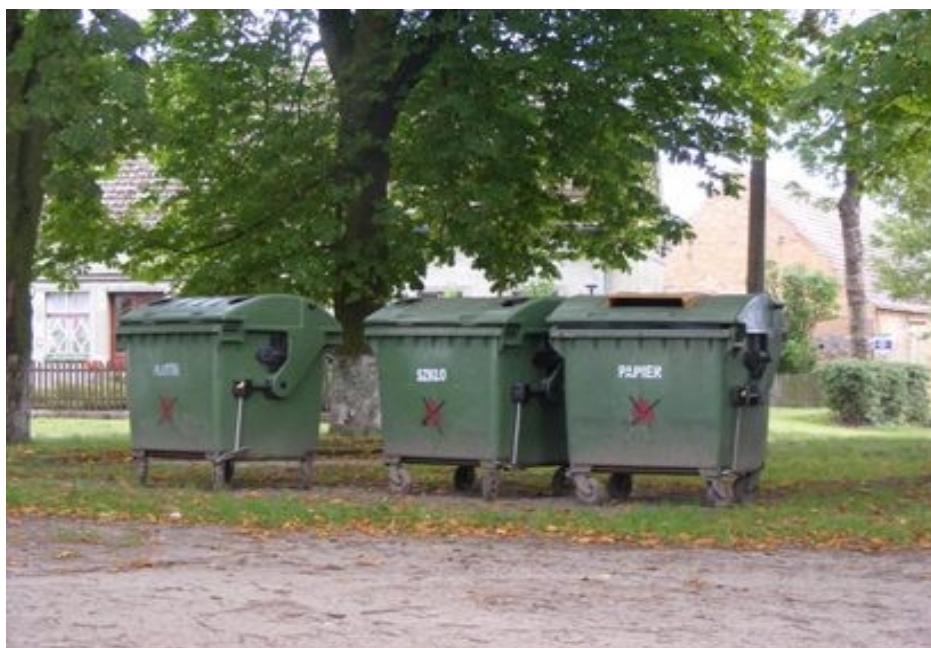
Pojemniki do selektywnej zbiórki odpadów w Mechowie

Na terenie Mechowa zlokalizowane są pojemniki do selektywnej zbiórki odpadów. Odbiór i transport zebranych odpadów prowadzony jest przez Zakład Gospodarki Komunalnej i Mieszkaniowej w Płotach.