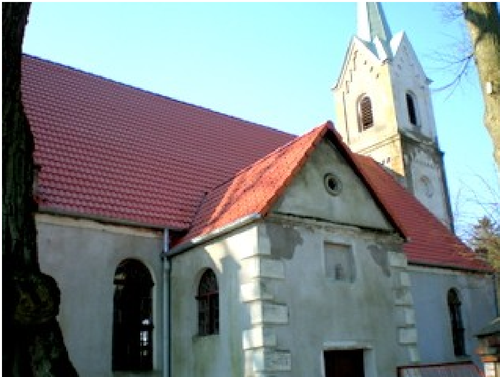
Kościół parafialny pw. Św. Józefa w Wicimicach