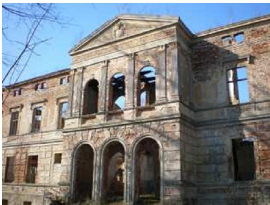
Ryc. 6. Pałac neorenesansowy w Wicimicach

W rejestrze zabytków znajduje się pałac (ruina w odbudowie), neorenesansowy z XIX wieku (Nr rej. 753) oraz park dworski (Nr rej. 904).