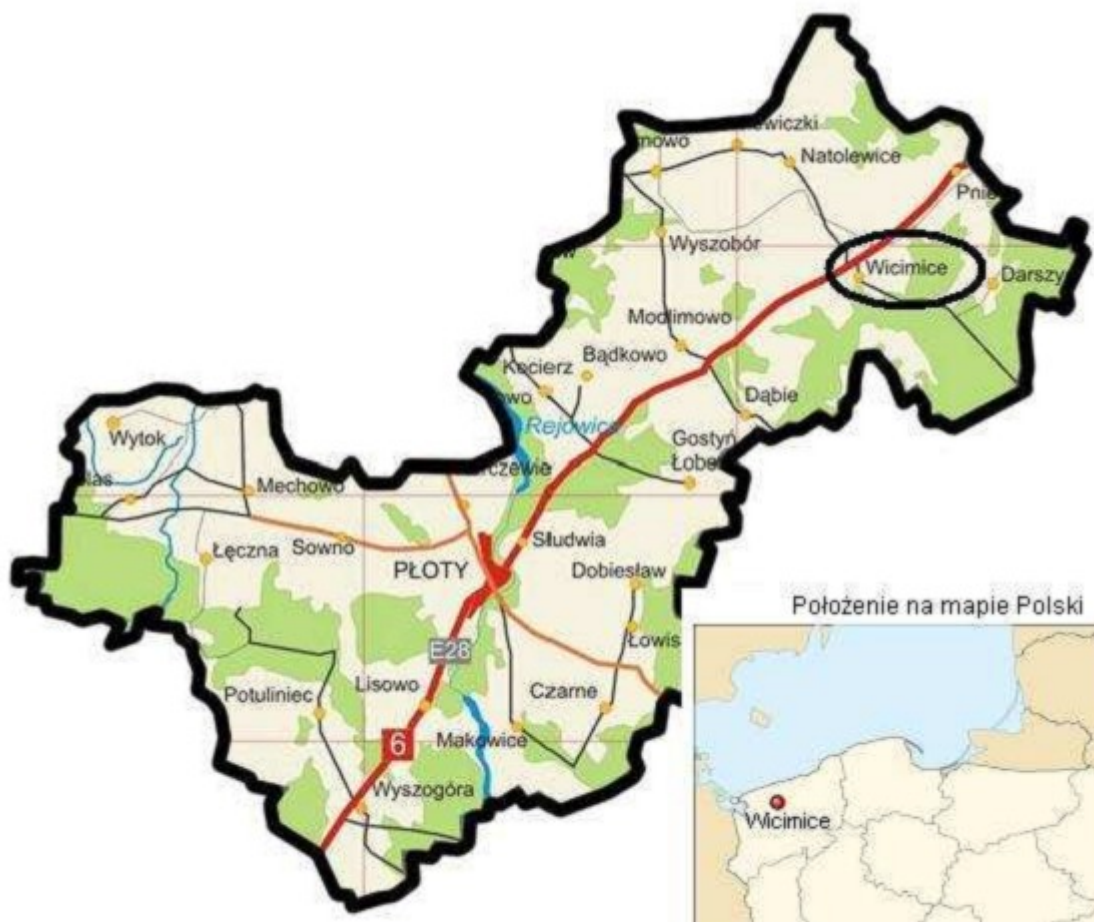
Ryc. 1. Położenie miejscowości Wicimice

Wicimice to wieś sołecka w gminie Płoty (powiat gryficki, województwo zachodniopomorskie). Położone są na południe od drogi krajowej nr 6 (E 28) od Płotów w kierunku na Koszalin i dalej do Gdańska (na długości geograficznej 53^{\circ} 52' 43.1'' północnej oraz na szerokości 15^{\circ} 23' 42'' wschodniej).