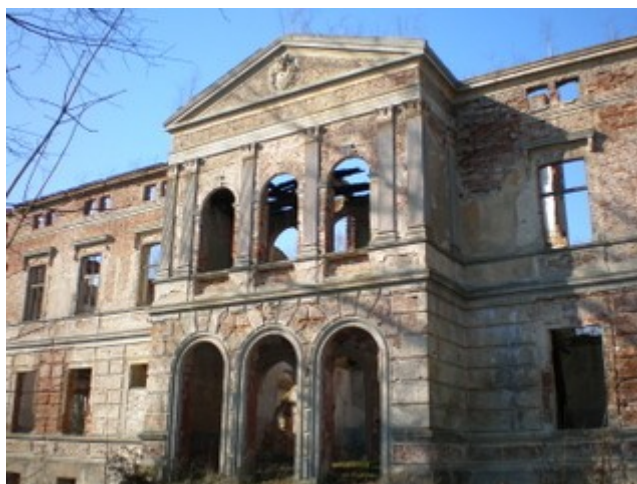
Pałac w Wicimicach

W ewidencji konserwatorskiej są następujące obiekty: