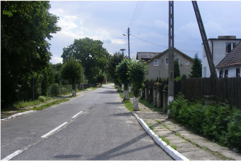
Droga przez Wicimice

Miejscowość jest bardzo dobrze skomunikowana. Przez północną część miejscowości przebiega droga krajowa nr 6 Szczecin-Gdańsk, stanowiąca najważniejsze połączenie komunikacyjne dla Koszalina ze stolicą województwa oraz trasę tranzytową pomiędzy Europą Zachodnią i państwami bałtyckimi (Litwą, Łotwą i Estonią).