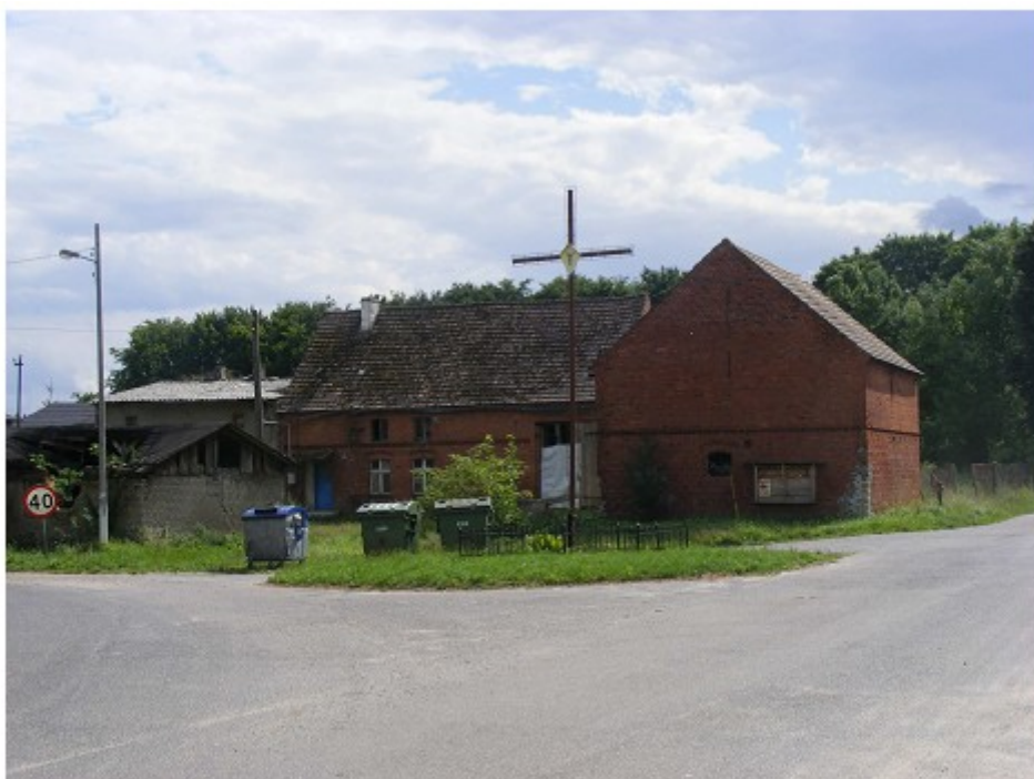
Ryc. 3. Wicimice