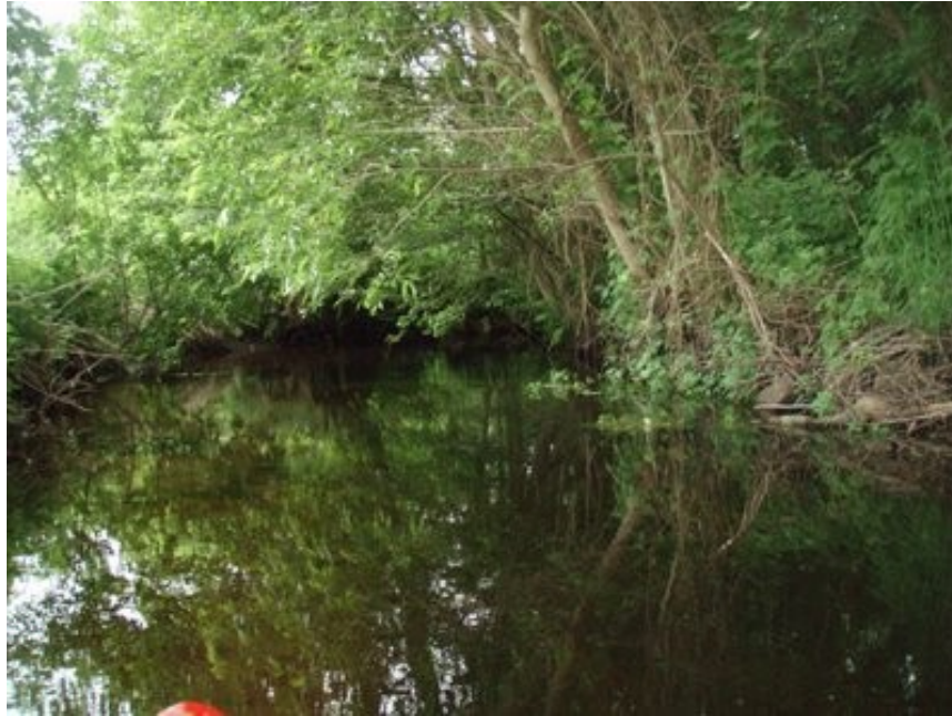
Nadbrzeżne szuwary rzeki Rekowa

W rejonie Wicimic znajdują się jedne z największych kompleksów torfowisk niskich (w dolinie Rekowej). Torfy niskie wytworzone są z roślinności szuwarowej i turzycowiskowej, przekształcone w łąki i pastwiska. Obecnie porasta je roślinność półkulturowa: łąki rdestowo-ostrożeńowe, podmokłe łąki z sitowiem leśnym, pastwiska z udziałem sitów, trzęśliwy modrej, śmiałka darniowego. Gdy zaniechano użytkowania rolniczego (wypasów i koszenia), zaczęły rozwijać się ziołorośla łąkowe oraz wkraczać zarośla wierzbowe (łozowiska), a w miejscach podmokłych - szuwar trzcinowy i turzyce. Lasy porastające torfowiska dolinne należą do olsów (olsy torfowiskowe i porzeczkowe).