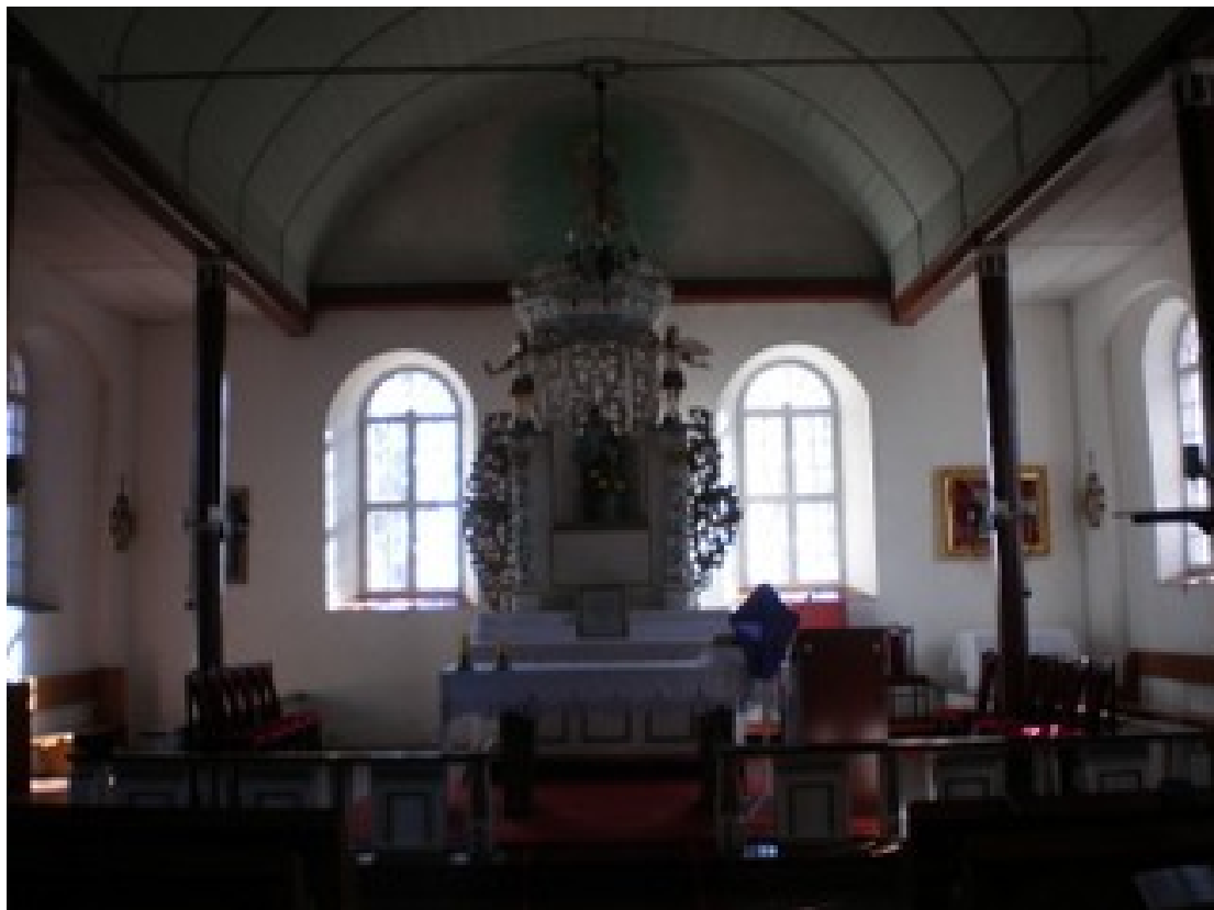
Wnętrze kościoła parafialnego pw. Św. Józefa w Wicimicach